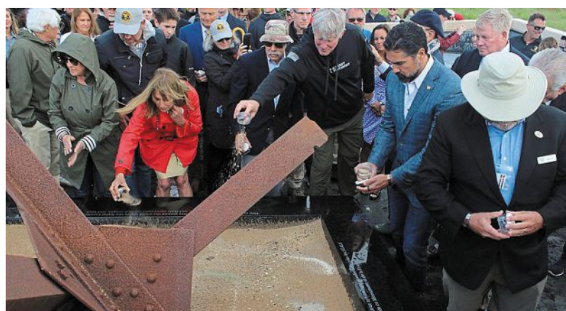
Au centre du mémorial, la plage vivante a été complétée. Les Navy Seals et leurs familles y ont déposé du sable de tous les lieux du monde où ils sont intervenus.

Le sable a ensuite été analysé pour évaluer sa résistance à la charge en vue du Débarquement des blindés. « Le mémorial est un repère, une