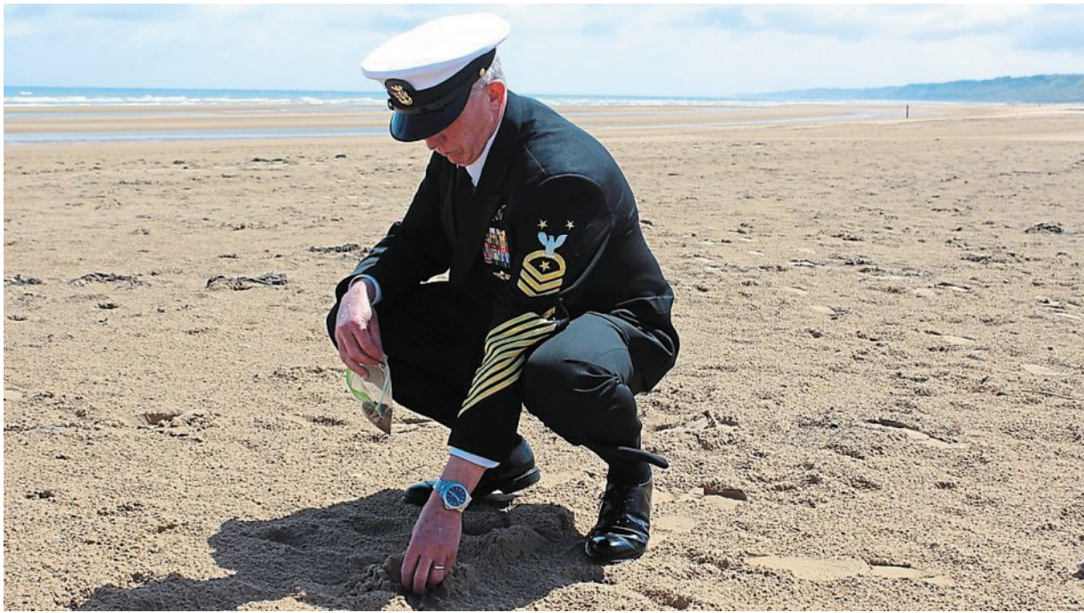
Pour les Navy Seals, le sable d'Omaha est considéré comme sacré.

« Quatorze NCDU et Scouts and Raiders sont inhumés au cimetière d'Omaha-Beach. Ce monument va dire qui étaient ces hommes. Ils étaient animés d'une foi et d'une