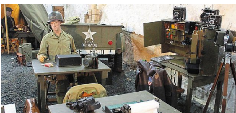
Trois thèmes sont exposés dans une salle de 300 m 2 au château de Vouilly dont un espace dédié aux correspondants de guerre.

Du samedi 1 er au dimanche 9 juin , au château de Vouilly. Tarif : 5 €, gratuit au moins de 18 ans.