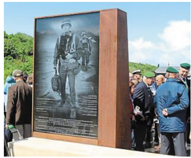
Composé de différentes stèles, le mémorial fait le lien entre les NCDU Scouts and Raiders et les Navy Seals, que sont devenues ces unités des forces spéciales.

Saint-Laurent-sur-Mer — Le 6 juin 1944, les ancêtres des Navy Seals ont joué un rôle déterminant dans le Débarquement. Un mémorial a été construit pour leur rendre hommage. Il a été inauguré hier.