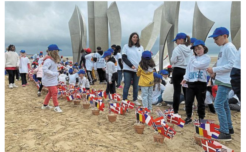
Le jeu consistait à récupérer les drapeaux des nations alliées pour les regrouper devant la statue des Braves.

Sur la plage, 240 enfants recherchent des drapeaux